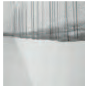
Zimoun 125 prepared dc-motors, filler wire 1.0mm, 2009/2010 installation view (detail)