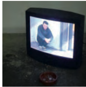
Silvano Repetto Videoelemosina (Videocharity), 2001 installation view