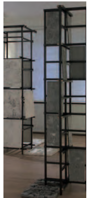
Niklaus Wenger Il ricovero degli artisti poveri II, 2011 Wood, Graphite, Screws, Gypsum, Pigments installation view